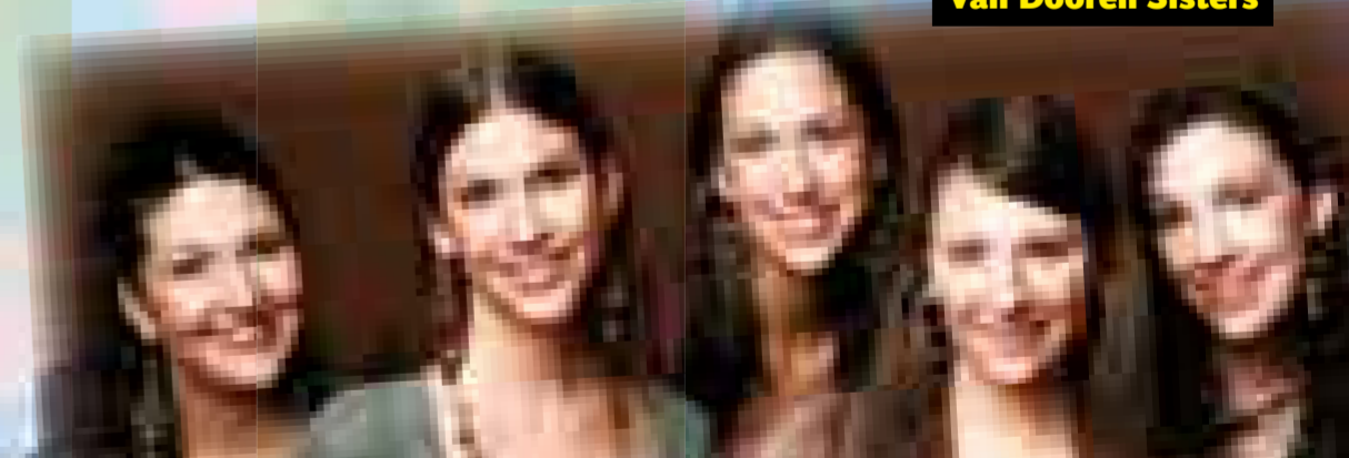
Van Dooren Sisters

Jg. 69, verheiratet mit Surya, 1 Kind, Pastor in Nepal